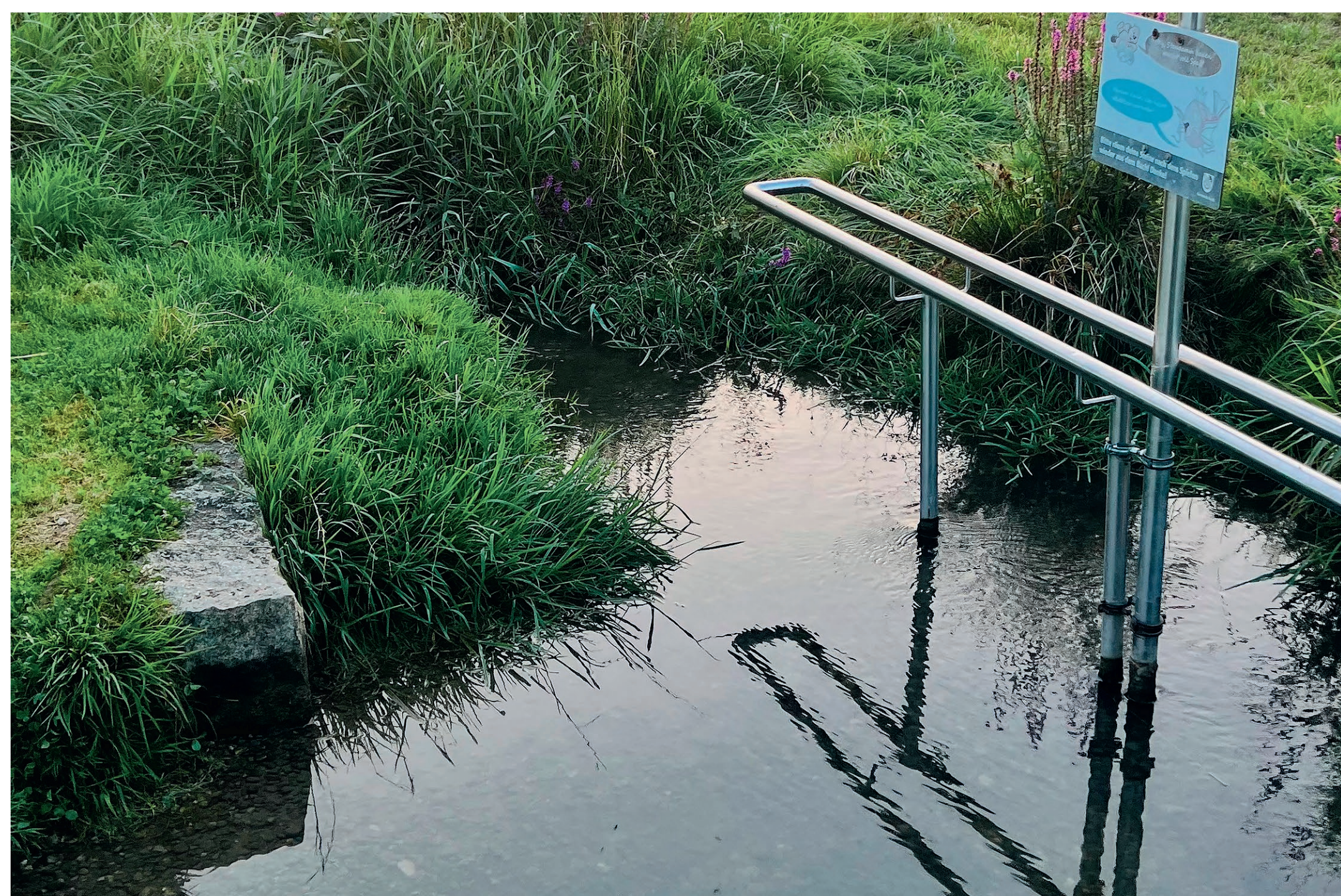
Neue Kneipp-Anlage im Further Bach.