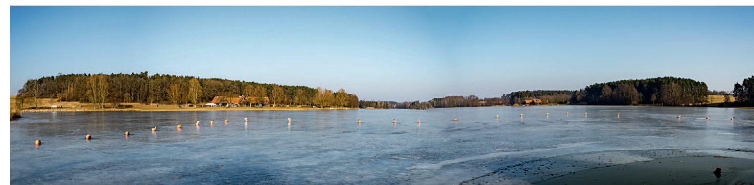
Egal ob Oberflächenwasser, wie hier der Rothsee, oder das versteckte Grundwasser – Wasser ist unsere wichtigste Ressource und braucht unseren Schutz.

Informieren Sie sich unter: www.grundwasserschutz.bayern.de