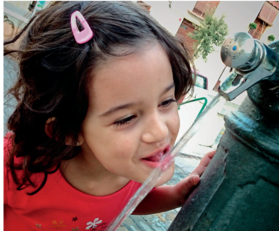
In Mittelfranken wird das Trinkwasser ausschließlich aus Grundwasser gewonnen. Wir wollen, dass sauberes Trinkwasser eine Selbstverständlichkeit bleibt.

Genau hier knüpft die AKTION GRUNDWASSERSCHUTZ an: Wir vermitteln Hintergrundwissen zur Wasserversorgung und zum Grundwasserschutz, zeigen Handlungsmöglichkeiten auf, schaffen Allianzen für den Trink- und Grundwasserschutz und setzen uns dadurch gleichzeitig für Nachhaltigkeit ein.