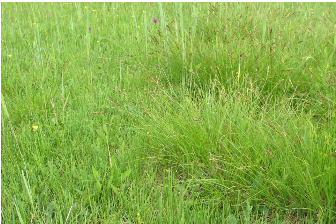
Abb. 5: Kalkreiches Niedermoor mit Carex hostiana , Mai 2010

Besonders nasse Stellen innerhalb der Niedermoore werden von kleinen Schnabelseggenrieden oder Gemeinschaften des Fieberklees eingenommen.