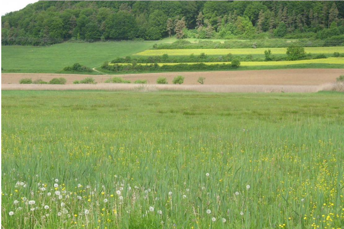
Abb. 9: Großseggenbestand von Süden

Die aufgelassene Feuchtwiese auf Flurstück 550/0 wird von einem artenarmen Schlankseggenried eingenommen. Eingestreut in das Ried wachsen kleine Herden von Brennnesseln, Ackerkratzdisteln, Rohrglanzgras und Roßminzen. Im Bestand verlaufen kleine, sich kreuzende Gräben, die zur Sicherstellung einer Mähbarkeit der Flächen seitens des Landschaftspflegeverbandes angelegt wurden.