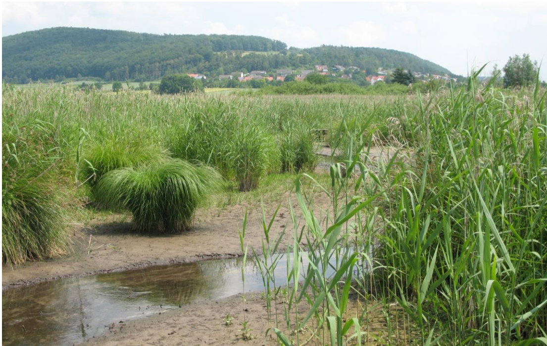
Abb. 11: Südlicher Quellgraben mit Seggenbulten, Juni 2010

Für eine Ansprache als LRT 3260, wie bei den Erhaltungszielen angedeutet, fehlt die notwendige Deckung der Gewässervegetation.