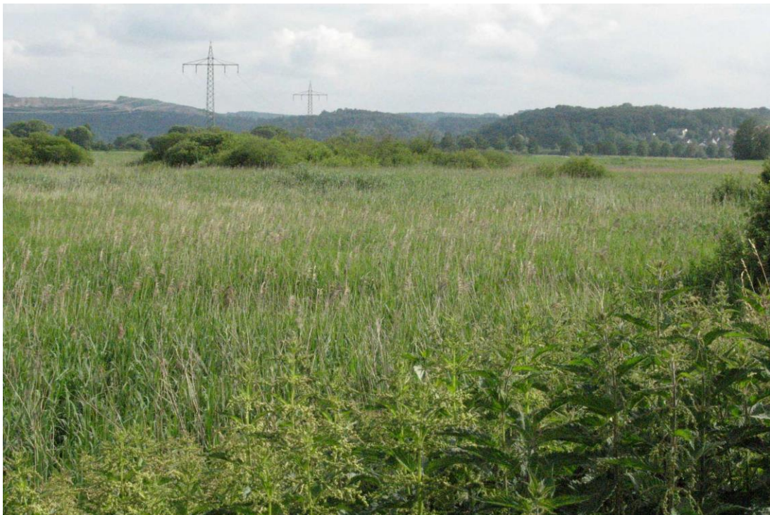
Abb. 8: Schilfröhricht am Nordwestrand des Gebietes

Die Bestände sind jeweils artenarm, meist dicht und an den Rändern immer mit den angrenzenden Vegetationsbeständen vermischt.