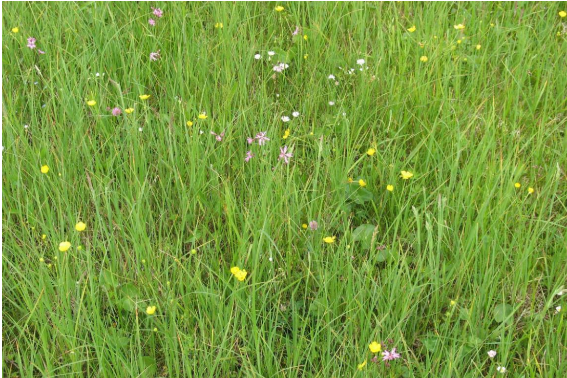
Abb. 10: Bestandsfoto der seggenreichen Nasswiese, Mai 2010