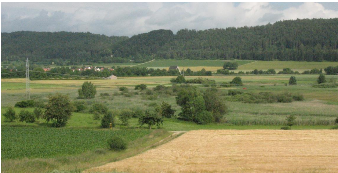
Abb. 1: Blick vom Nagelsberg auf das Schambachried