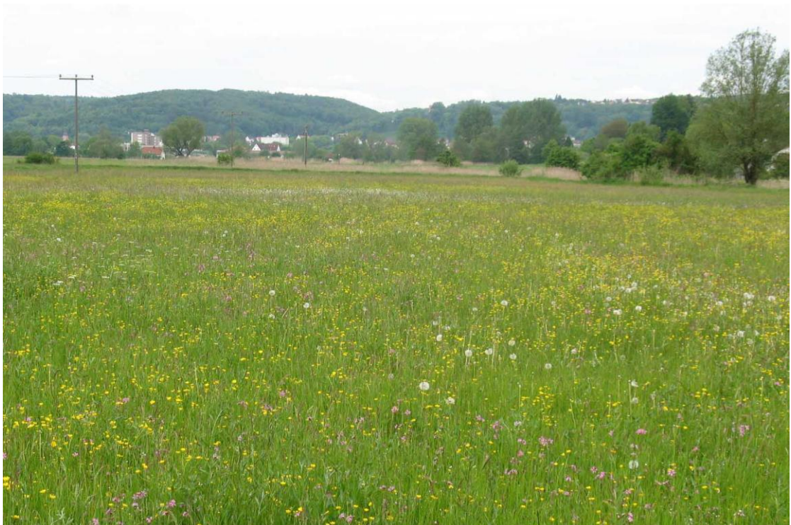
Abb. 6: Flachland-Mähwiese im Mai 2010, Blick nach Westen

Die Wiese wird nicht mehr gedüngt und erst ab dem 1. Juli gemäht. Sie wird nach dem Bayerischen Kulturlandschaftsprogramm gefördert.