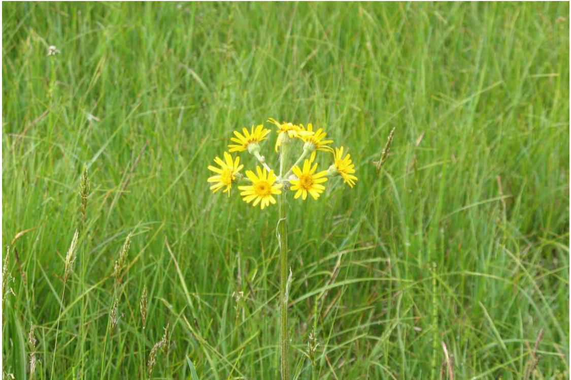
Abb. 12: Tephrosia helenitis , Mai 2010

Mehr als 25 Jahre alte Artnachweise, die nicht mehr bestätigt werden konnten liegen vor für Blysmus compressus , Carex viridula var. viridula , Crepis mollis , Cyperus fuscus , Dactylorhiza incarnata , Gentiana verna , Juncus alpinus , Pedicularis sylvatica , Polonium caeruleum , Ranunculus polyantemophyllus , Sagina nodosa und Salix repens .