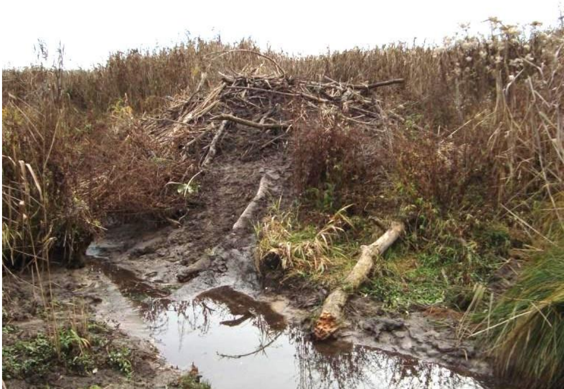
Abb. 7: Biberburg im Schambachried

Seit den 1990er Jahren nutzt der Biber das Schambachried als Lebensraum. Von hier aus hat er sich auch weiter entlang des Schambachs ausgebreitet. Im Gebiet lebt eine Biberfamilie in einer aus Schilf gebauten Biberburg, die Quellbäche werden immer wieder angestaut. Seine Gänge sind im Schilf zu geeigneten Zeiten gut erkennbar. Mit den Aktivitäten des Bibers ist der Grundwasserspiegel im Gebiet über die Jahre wieder angestiegen und hat zu Vernässungen der Feuchtlebensräume und Wiesen geführt.