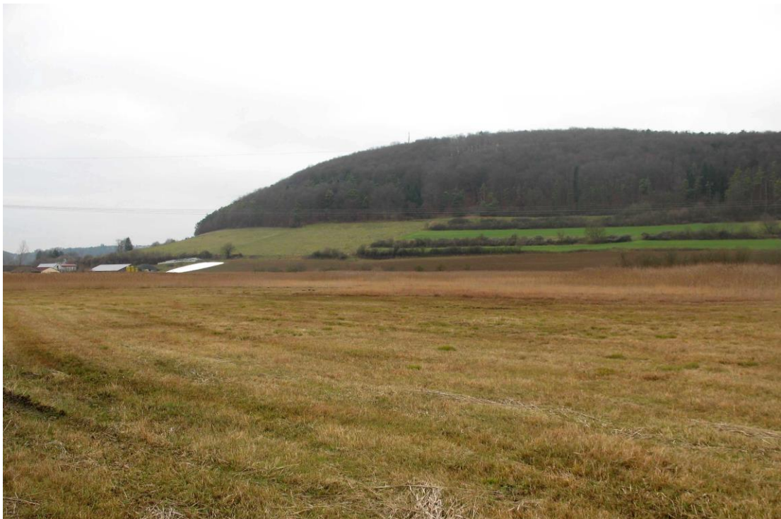
Abb. 3: Mahd der Pfeifengraswiesen im Herbst 2010

Der Kernbereich des Naturschutzgebietes wird regelmäßig im Herbst gemäht. Die Wiese auf Flurstück 594/0 wird zweimal im Jahr gemäht, der erste Schnittzeitpunkt liegt nach dem 1. Juli. Die Wiese wird über das Bayerische Kulturlandschaftsprogramm gefördert, eine Düngung erfolgt nicht. Die sonstigen Flächen, ca. zwei Drittel des Gebietes, sind ungenutzt.