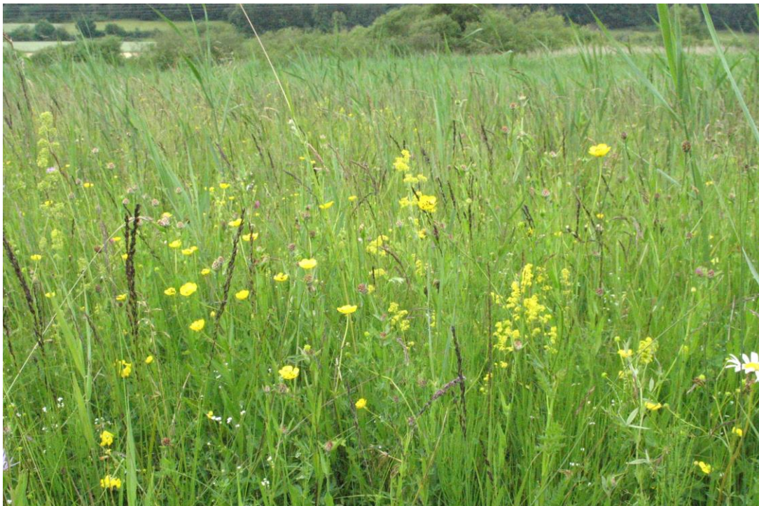
Abb. 4: Krautreiche Pfeifengraswiese im Juni 2009

Pfeifengraswiesen nehmen den Großteil der zentralen Niedermoorfläche ein. Das Pfeifengras ist die bestandsprägende Art, es ist durchgehend rasig ausgebildet.