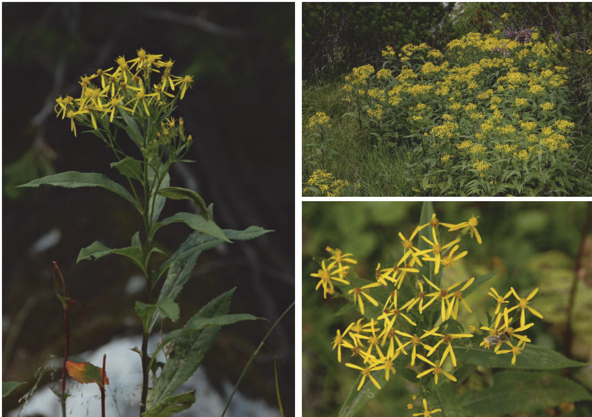
Fuchs' Greiskraut ( Senecio ovatus)