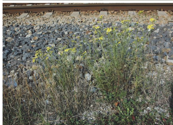
Schmalblättriges Greiskraut ( Senecio inaequidens)