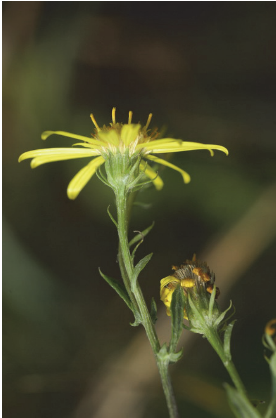
Raukenblättriges Kreuzkraut ( Senecio erucifolius ; Fotos: A. Zehm)