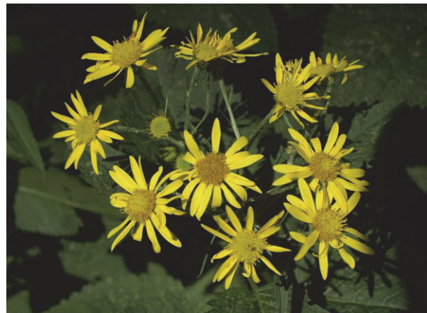
Alpen-Greiskraut ( Senecio alpinus)