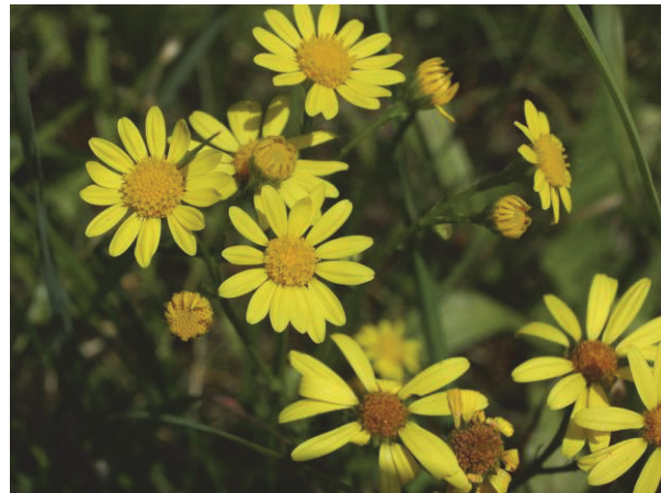
Wasser-Kreuzkraut ( Senecio aquaticus)