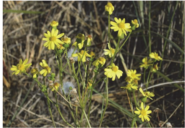
Jakobs-Kreuzkraut ( Senecio jacobaea )