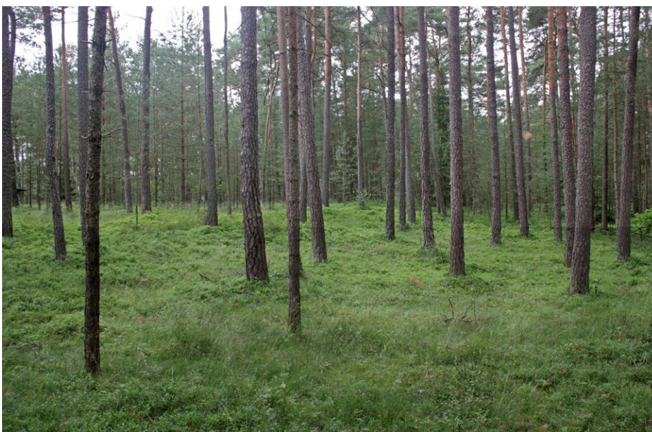
In diesem nährstoffarmen, lichten Kiefernforst bei Sengenthal wächst ein stabiles Vorkommen von Pyrola media.

Die Ausgangssubstrate der Art sind vielfältig. In den Mittelgebirgen besiedelt die Art überwiegend sauer verwitternde Böden des Keupers und der Grundgebirge. Im Alpen und Voralpenraum werden Dolomit-Gesteine bevorzugt, allerdings unter sauren, modrig-humosen Bodenbedingungen.