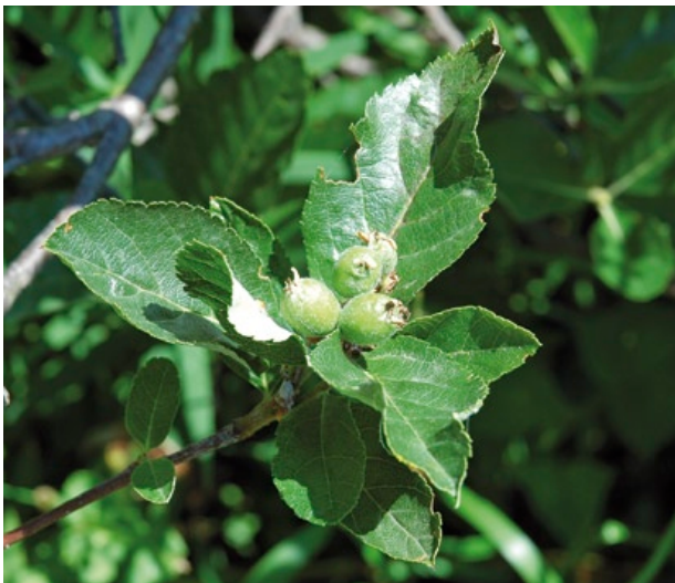
Fruchtstand des Endemiten Allgäuer Zwerg-Mehlbeere ( Sorbus algoviensis ) nahe Oberstaufen.