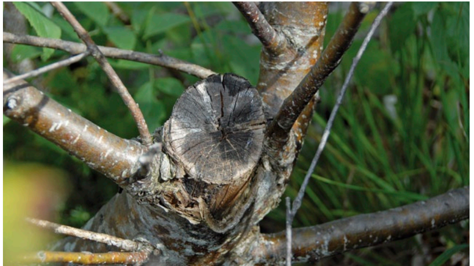
Den meisten Bewirtschaftern von Almen und Alpen ist unbekannt, welche seltenen oder gar weltweit einmaligen Pflanzenarten auf ihren Almen wachsen. Dieser Stamm einer sehr seltenen Mehلبere ( S. austriaca ) hat das Absägen überlebt und treibt wieder aus.

Die sehr seltene Gebirgs-Vogelbeere ( S. aucuparia subsp. glabrata ) ist wegen des zerstreuten Vorkommens, der geringen Individuenzahl und Verdrängungsbastardisierung durch die Gewöhnliche Vogelbeere der Tieflagen kaum zu