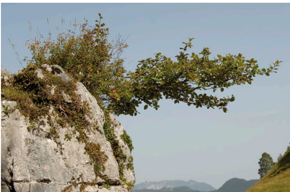
Waagerechter Wuchs einer Österreichischen Mehlbeere ( S. austriaca ) auf einer Alm bei Ramsau. Von dieser Art sind in Bayern aktuell rund 250 Büsche bekannt (MEYER 2009).

Alle drei Hauptarten wachsen bis in den Bereich der alpinen Baumgrenze, wo sie bis in die Latschen-Krummholzbereiche und die Zwergstrauchheiden vordringen. Während Mehlbeeren und Vogelbeeren bis hinab ins Hügelland häufig vorkommen, ist die Zwerg-Mehlbeere eine Gebirgsart der Krummholzzone. Allen gemeinsam ist ein Pioniercharakter und hoher Lichtbedarf. Nur in der Jugend ist die Schattentoleranz höher und erlaubt ein kümmerliches Aufkommen als Unterwuchs. Entstehen Lichtlücken, können sie aufwachsen und Früchte bilden. Die Arten kommen nur außerhalb dichter Wälder in durch Schuttströme, Windbrüche usw. gestörten Bereichen vor oder besiedeln Sonderstandorte wie Felsbänder.