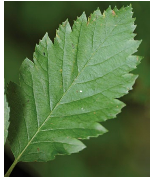
Blatt der Österreichischen Mehlbeere ( S. austriaca ) mit einer typischen groben, tief eingeschnittenen Zählung des Blattrandes.

Genauere Untersuchungen zeigen, dass sich ungeschlechtlich vermehrende Pflanzen – wie die fixierten Mehlbeeren – nicht in einer evolutiven Sackgasse gefangen sind. Vielmehr stabilisiert die ungeschlechtliche Fortpflanzung gut angepasste Formen, die so rasch geeignete Flächen besiedeln können. Gelegentlich eingeschobene sexuelle Fortpflanzungen erzeugen neue Genkombinationen und durchmischen den Genpool. Die Zwischenarten stellen damit unabhängige genetische Reservoirs der