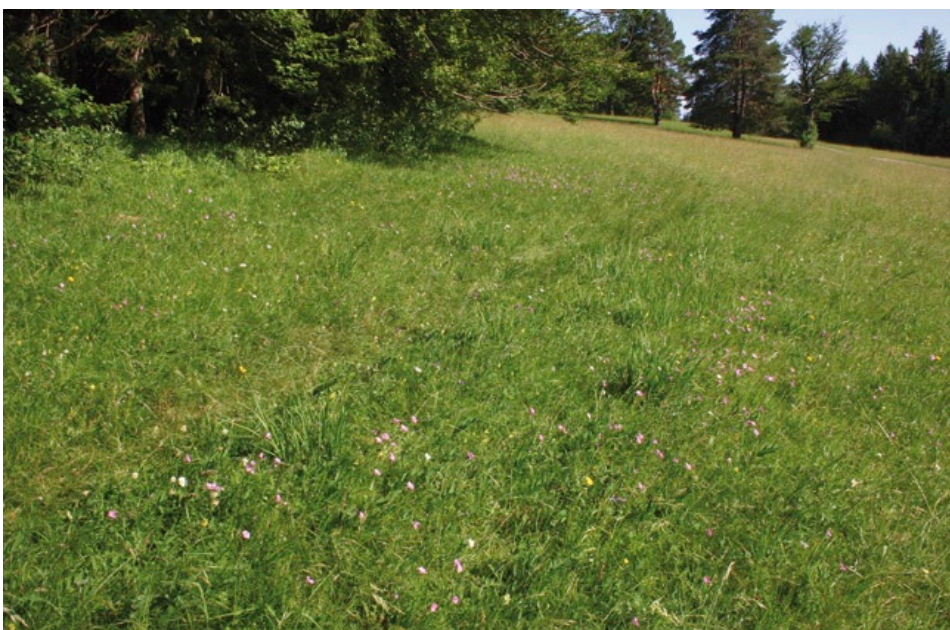
Wuchsort des Klebrigen Leins am Rand eines nährstoffarmen, niedrigwüchsigen Kalkmagerrasens im Alpenvorland bei Weilheim (Foto: Burkhard Quinger).

In der bayerischen Roten Liste ist der Klebrige Lein derzeit als „stark gefährdet“ eingestuft (SCHEUERER & AHLMER 2003). Die Einstufung „gefährdet“ in der Roten Liste Deutschlands ist zu aktualisieren und anzupassen, da die Art in Deutschland nur in Bayern vorkommt.