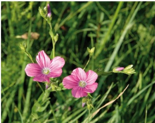
Blütenstand des Klebrigen Leins.