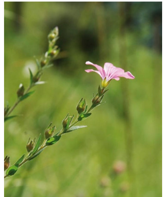
Als heller Rand werden im Gegenlicht die Drüsenhaare sichtbar, die Stängel und Blättern ihr klebriges Äußeres verleihen.

Gegenüber Beweidung durch Rinder (HÖLZEL 1996) und erst recht durch Schafe ist der Klebrige Lein recht empfindlich, da er gerne gefressen wird. Mahd verträgt der von Mitte Juni bis in den frühen August blühende Klebrige Lein offenbar erst ab Anfang August, da er erst spät Samen produziert, die neue Ansiedlungen ermöglichen.