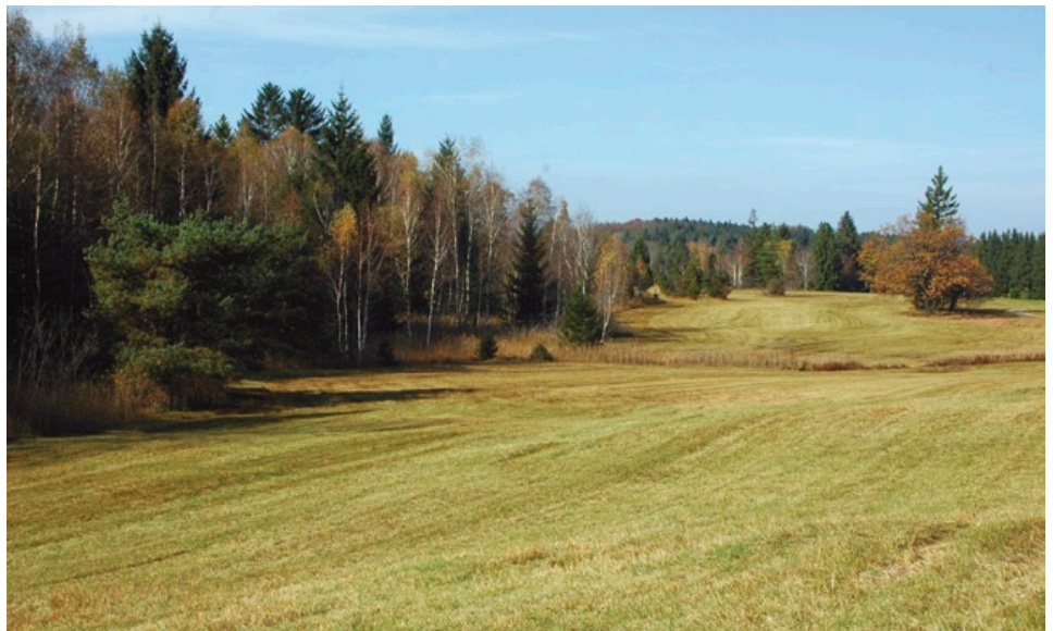
Mahd im August ermöglicht dem Klebrigen Lein ein Aussamen und verhindert, dass stark wüchsige Pflanzenarten, wie beispielsweise Hochstauden, überhand nehmen.