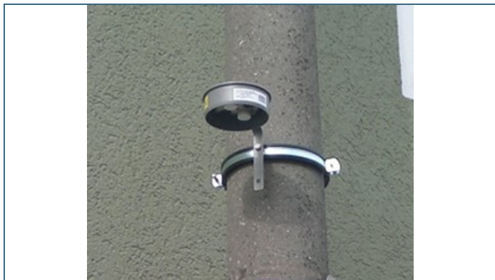
Abb. 4: Wetterschutzgehäuse mit Passivsammlern; die beiden Sammeleinheiten sind als weiße Plastikkapseln gut zu erkennen