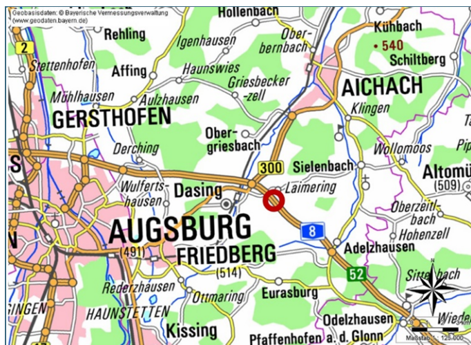
Abb. 1: Übersichtskarte mit markiertem Untersuchungsgebiet an der A8 in der Nähe der Anschlussstelle Dasing bei Augsburg

In Abb. 1 ist das Untersuchungsgebiet an der A8 in der Nähe der Anschlussstelle Dasing bei Augsburg in einer Übersichtskarte dargestellt.