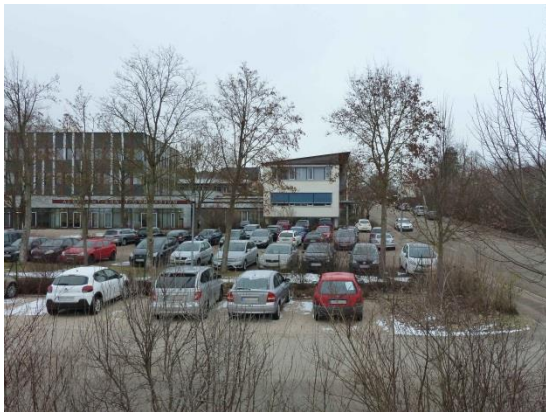
Stationsumgebung Blickrichtung Nord (Aufnahme: Januar 2019)

© Daten: Bayerische Vermessungsverwaltung, EuroGeographics