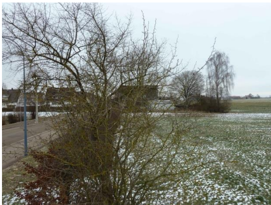
Stationsumgebung Blickrichtung Süd (Aufnahme: Januar 2019)