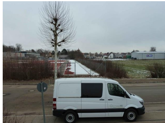
Stationsumgebung Blickrichtung Ost (Aufnahme: Januar 2019)