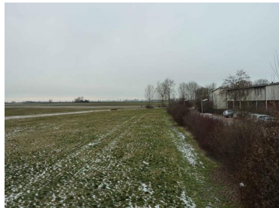
Stationsumgebung Blickrichtung West (Aufnahme: Januar 2019)