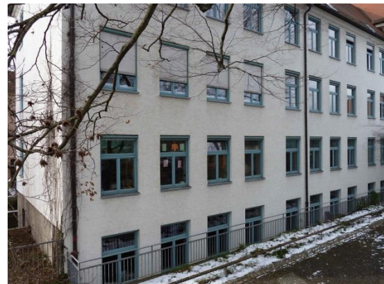
Stationsumgebung Blickrichtung West (Aufnahme: Januar 2019)