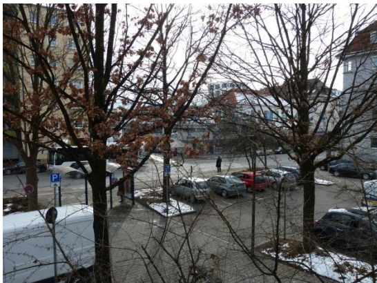
Stationsumgebung Blickrichtung Süd (Aufnahme: Januar 2019)