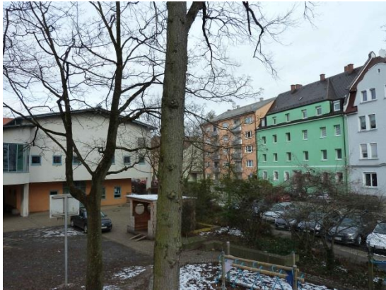
Stationsumgebung Blickrichtung Nord (Aufnahme: Januar 2019)

© Daten: Bayerische Vermessungsverwaltung, EuroGeographics