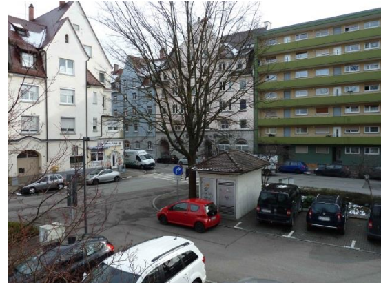
Stationsumgebung Blickrichtung Ost (Aufnahme: Januar 2019)