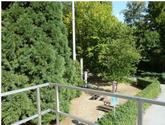
Stationsumgebung Blickrichtung Nord (Aufnahme: August 2018)