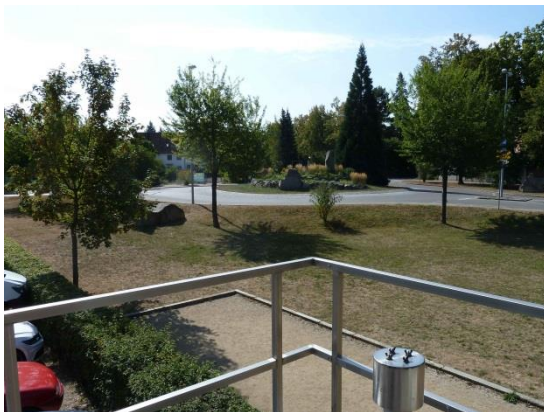
Stationsumgebung Blickrichtung Süd (Aufnahme: August 2018)