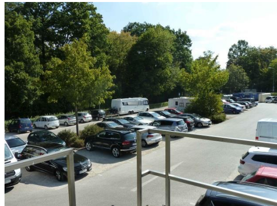
Stationsumgebung Blickrichtung Ost (Aufnahme: August 2018)