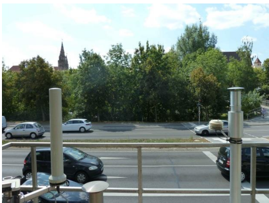
Stationsumgebung Blickrichtung Süd (Aufnahme: August 2018)