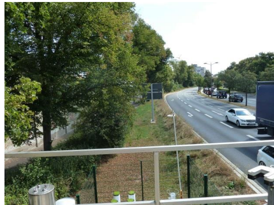
Stationsumgebung Blickrichtung Ost (Aufnahme: August 2018)