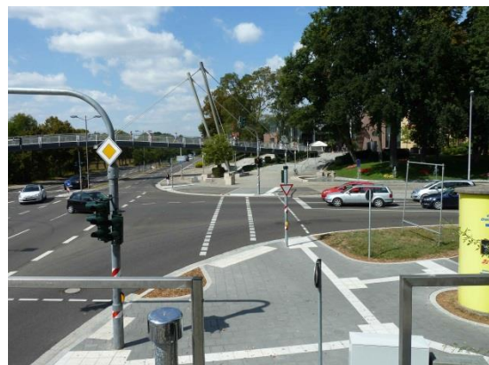
Stationsumgebung Blickrichtung West (Aufnahme: August 2018)