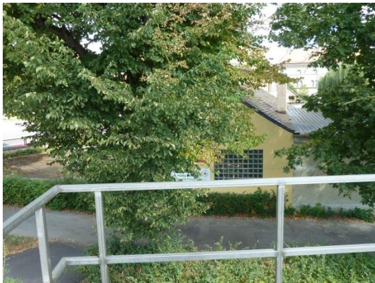
Stationsumgebung Blickrichtung Nord (Aufnahme: August 2018)