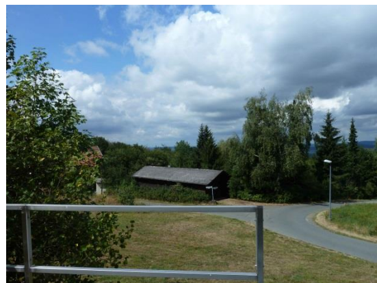
Stationsumgebung Blickrichtung West (Aufnahme: August 2018)