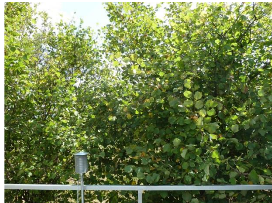
Stationsumgebung Blickrichtung Ost (Aufnahme: August 2018)