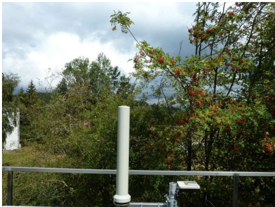
Stationsumgebung Blickrichtung Nord (Aufnahme: August 2018)

© Daten: Bayerische Vermessungsverwaltung, EuroGeographics