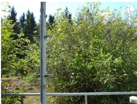
Stationsumgebung Blickrichtung Süd (Aufnahme: August 2018)