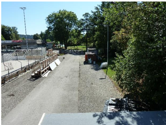
Stationsumgebung Blickrichtung Süd (Aufnahme: September 2019)