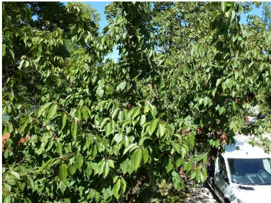
Stationsumgebung Blickrichtung Nord (Aufnahme: September 2019)

© Daten: Bayerische Vermessungsverwaltung, EuroGeographics