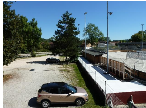
Stationsumgebung Blickrichtung Ost (Aufnahme: September 2019)