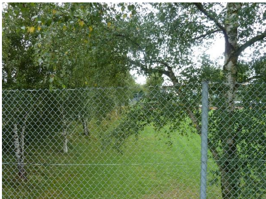
Stationsumgebung Blickrichtung Süd (Aufnahme: September 2019)