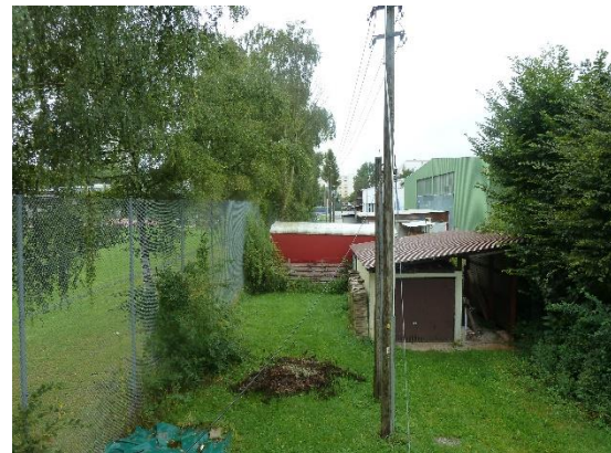
Stationsumgebung Blickrichtung West (Aufnahme: September 2019)