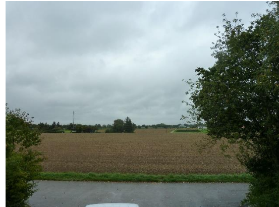
Stationsumgebung Blickrichtung Ost (Aufnahme: September 2019)