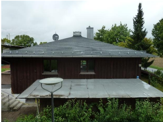
Stationsumgebung Blickrichtung Nord (Aufnahme: September 2019)

© Daten: Bayerische Vermessungsverwaltung, EuroGeographics