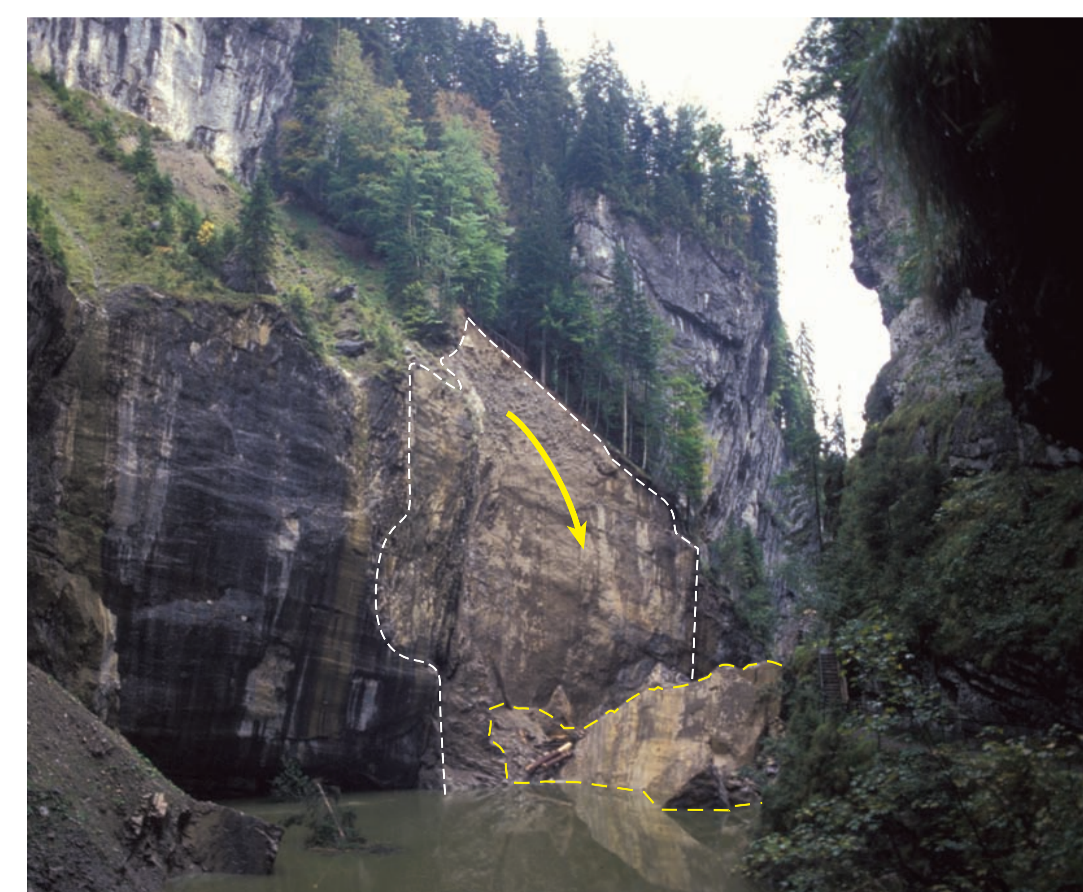
Ausbissnische und Felssturzmasse

Im Herbst 1995 brachen im Sattelscheitel zehntausende Kubikmeter Gestein aus der westlichen Felswand heraus und stürzten in die Klamm. Sie verbauten das Flussbett mehrere Meter hoch und stauten die Breitach zu einem See auf. Während der Schneeschmelze im folgenden Frühjahr brach der Damm und eine Flutwelle, die im Engbereich der Klamm bis zu 35 Meter Höhe erreichte, verwüstete den Klammweg.